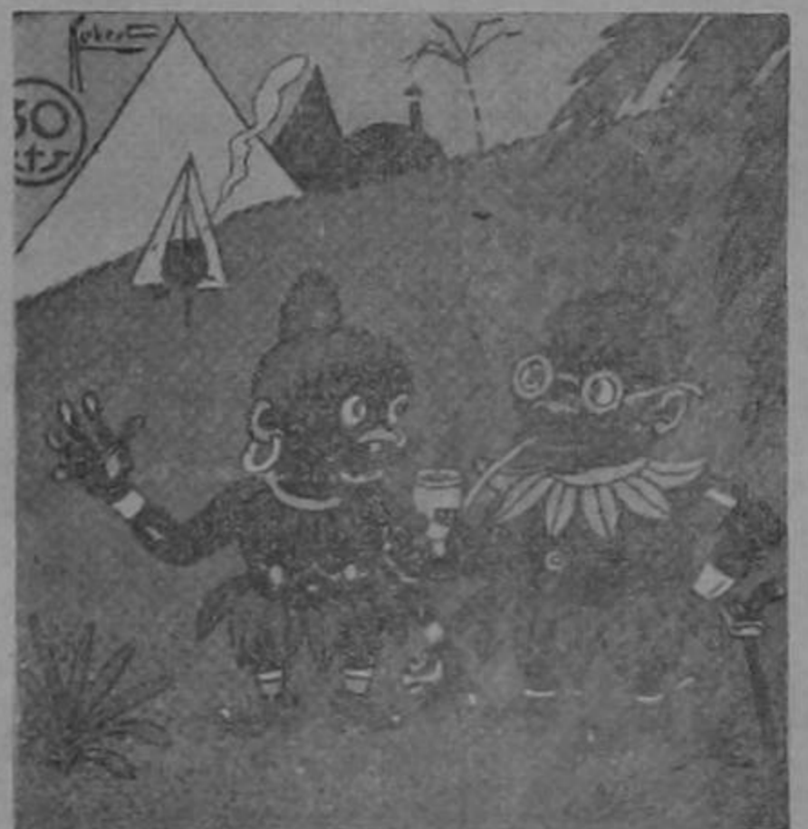
—¿Qué tenemos hoy para comida? —Unos recién casados. —¡Caramba! ¡Cómo estarán de tiernecitos!

Don Alejandro pasa al baño, Pasa a la pág. OCHO